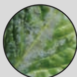
Борошниста роса буряка